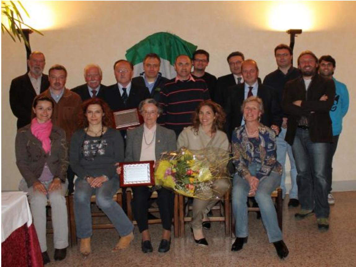
Dottori Agronomi e Forestali